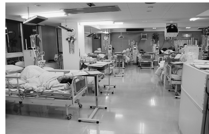
血液透析センター