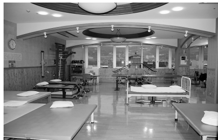
リハビリテーション科

また、地域の急性期病院としての役割も考えDPC対象病院を目指し現在活動しているところです。